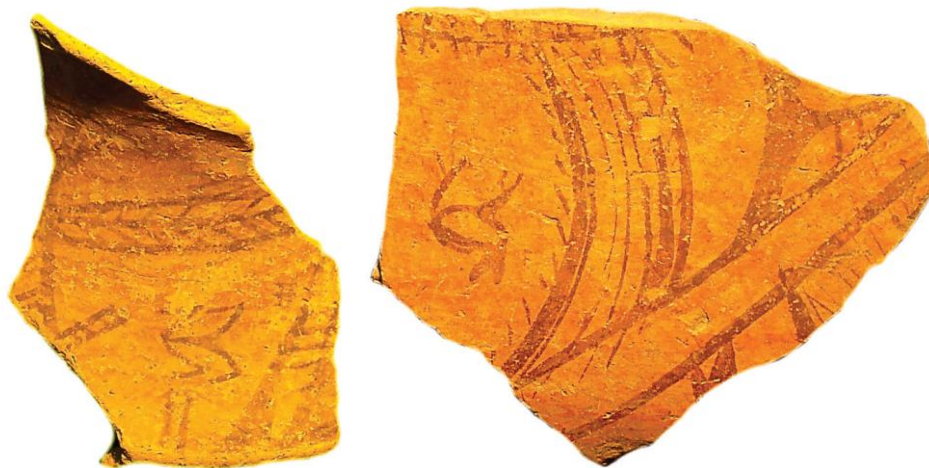
Фрагменти посуду Канівської групи з колекції В.Хвойки (НМІУ)

В.Хвойка (8.02.1850 - 2.11.1914) - видатний український вчений-археолог. Єдиною втіхою і метою його життя стали археологічні розкопки, спроба відтворити найстародавнішу історію, докопатись до коріння появи східних слов'ян на цій землі. Його розкопки охоплюють величезні території України, в тому числі і Канівщини. В 1897 році Вікентій Хвойка відкриває поселення трипільської культури поблизу сіл Грищенці, Пекарі, Хмільна , а в 1901 році відкриває і проводить розкопки поселення поблизу с. Кононча .