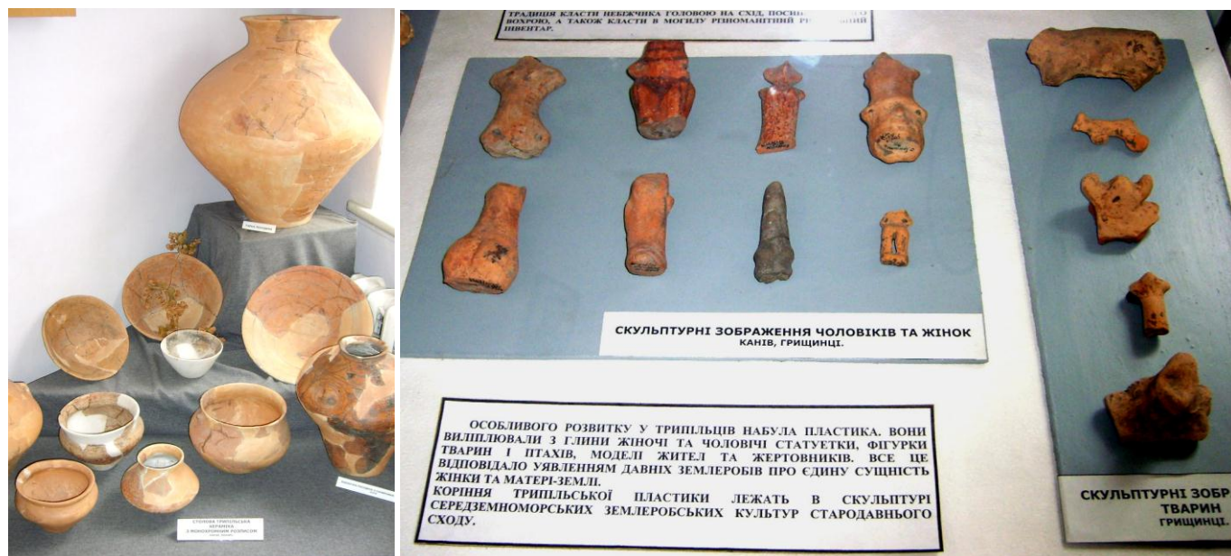
Фрагмент експозиції трипільської культури Канівського історичного музею

населення канівської групи взяла участь у формуванні трипільських пам'яток лукашівського типу на лівому березі Дніпра.